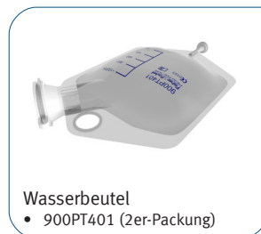
Wasserbeutel • 900PT401 (2er-Packung)