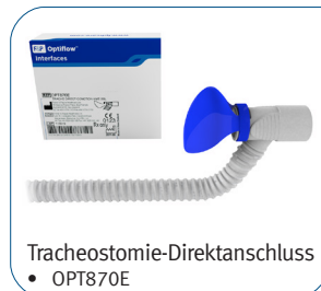
Tracheostomie-Direktanschluss • OPT870E