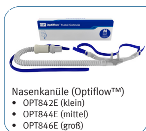
Nasenkanüle (Optiflow™) • OPT842E (klein) • OPT844E (mittel) • OPT846E (groß)