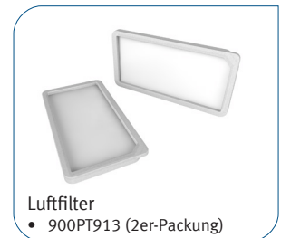
Luftfilter • 900PT913 (2er-Packung)