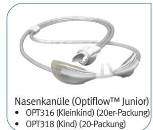
Nasenkanüle (Optiflow™ Junior) • OPT316 (Kleinkind) (20er-Packung) • OPT318 (Kind) (20-Packung)