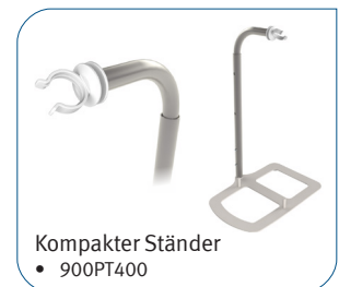
Kompakter Ständer • 900PT400