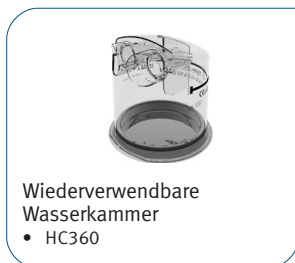
Wiederverwendbare Wasserammer • HC360