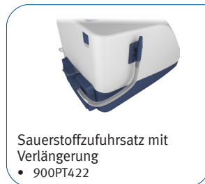
Sauerstoffzufuhrsatz mit Verlängerung • 900PT422