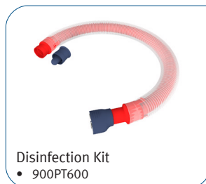
Disinfection Kit • 900PT600