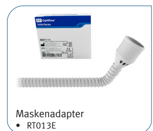
Maskenadapter • RT013E