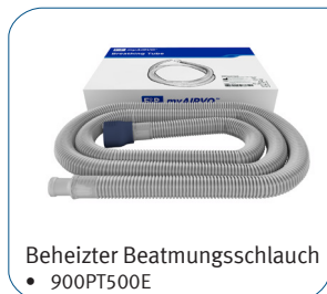
Beheizter Beatmungsschlauch • 900PT500E