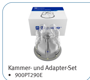
Kammer- und Adapter-Set • 900PT290E